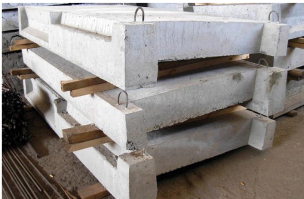
Рисунок 3 - Лестничные площадки плоские

Основные размеры площадок приведены в таблице 2.