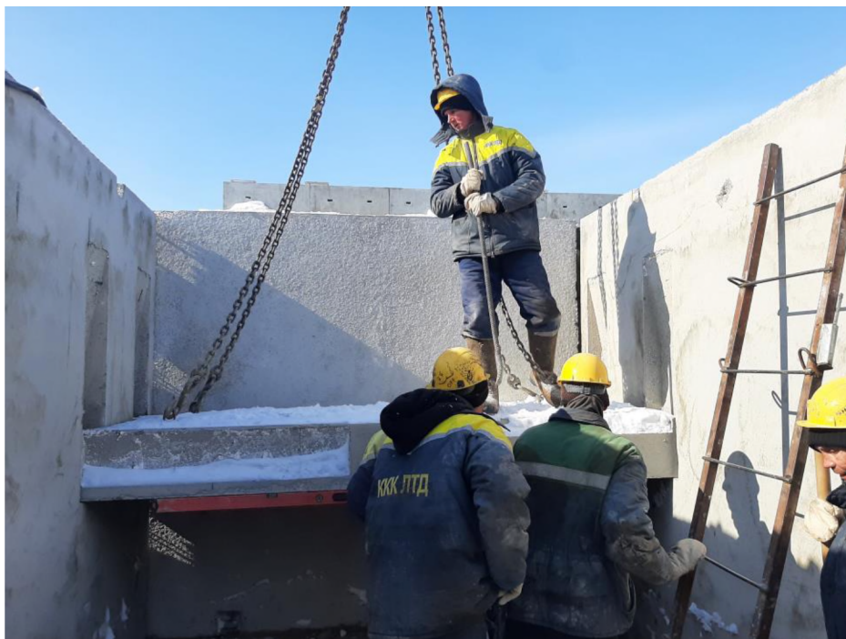
Рисунок 7 - Установка лестничной площадки