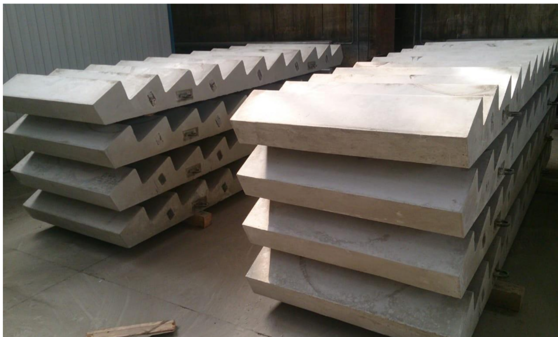
Рисунок 1 - Лестничные марши ЛМ плоские

Основные размеры маршей приведены в таблице 1.