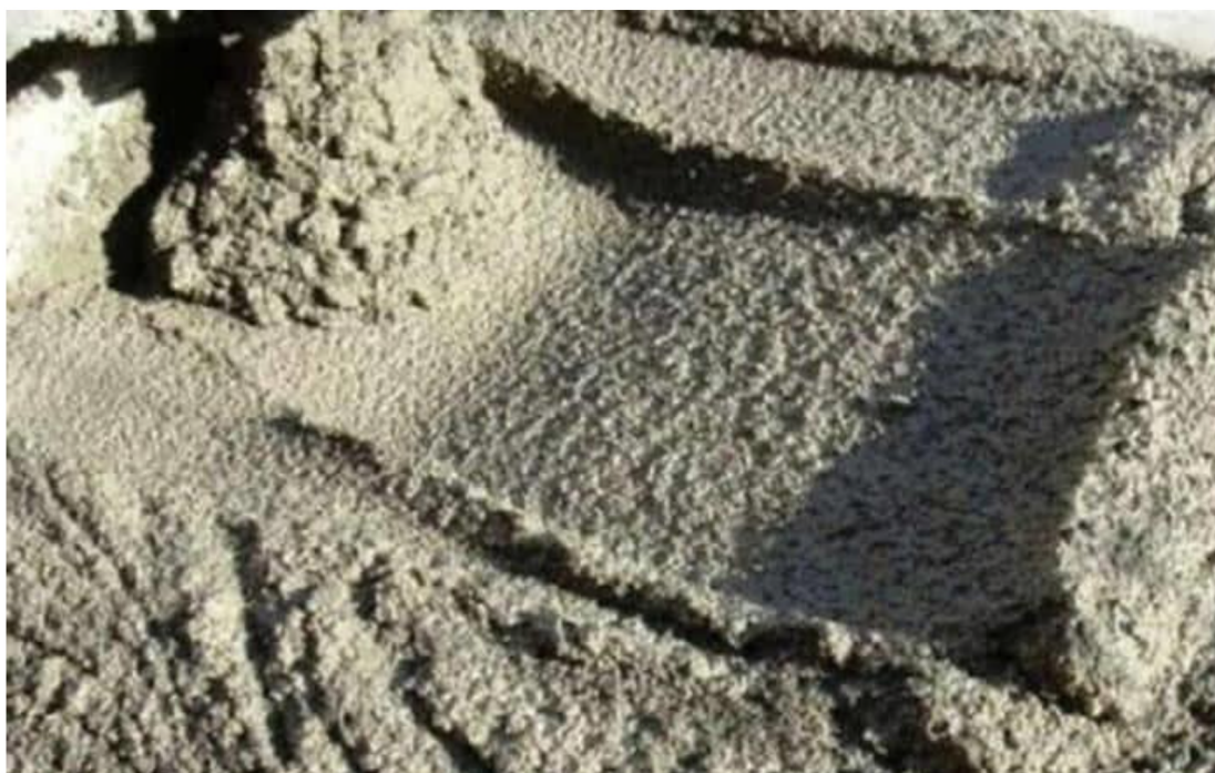
Рисунок 4 – Цементный раствор

Цементный раствор приведен на рисунке 4.