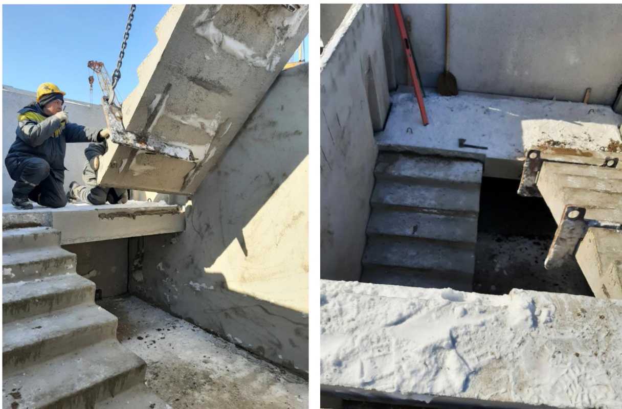
Рисунок 7 - Установка лестничных маршей

После окончания монтажа лестницы устанавливают временные ограждения площадок и маршей.