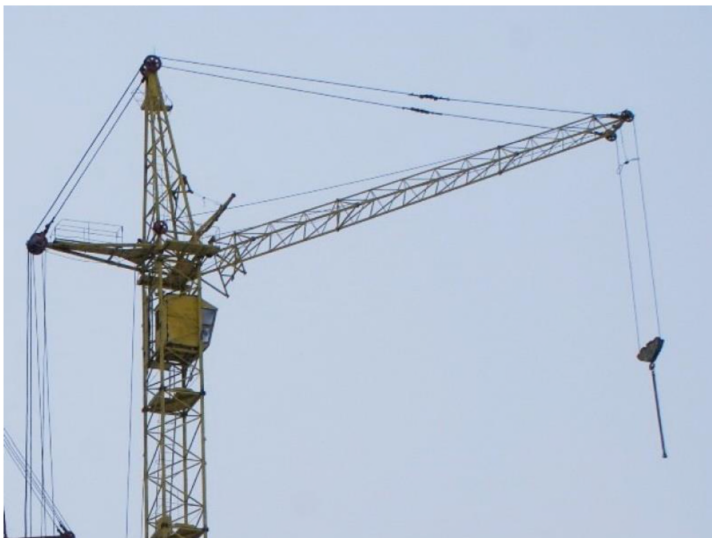
Рисунок 5 – Общий вид башенного крана

Основные технические характеристики крана приведены в таблице 4.