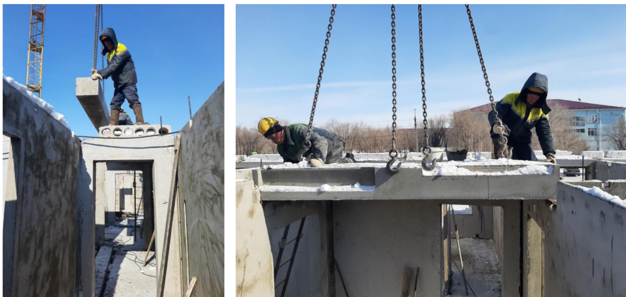
Рисунок 6 - Установка лестничных балок