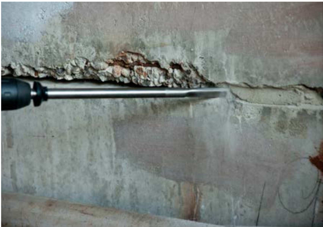
Рисунок 2 – Расшивка штрабы (шва) электроперфоратором