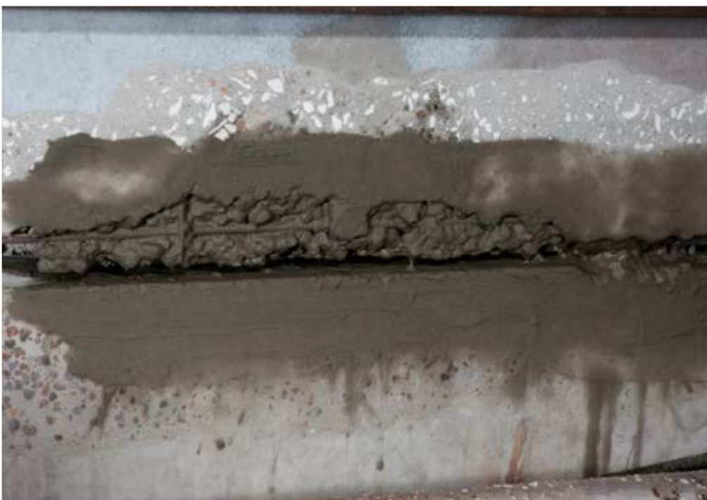
Рисунок 5 – Штроба готовая для заделки гидроизоляционным шовным составом