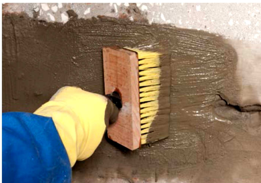
Рисунок 8 - Обработка штрабы заполненной гидроизоляционным шовным составом вручную гидроизоляционным проникающим составом

7а – заделка штрабы гидроизоляционным шовным составом; 7б – частично заполненная штраба гидроизоляционным шовным составом.