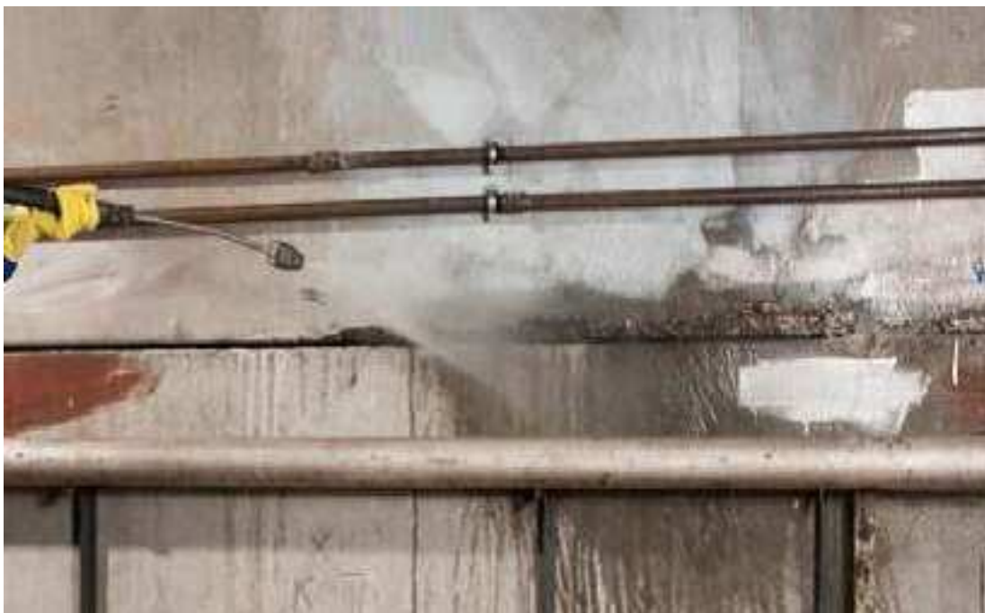
Рисунок 3 – Очистка и пропитка штрабы водой с применением аппарата высокого давления