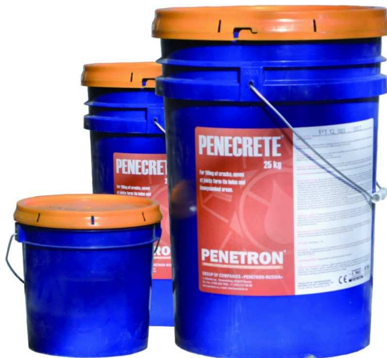
Рисунок 1 – Гидроизоляционные шовные составы расфасованные в полимерные тары.