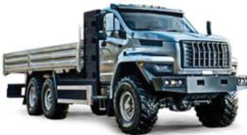
Рисунок 5 – Общий вид грузового автомобиля