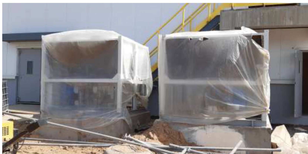
Рисунок 6 – Процесс монтажа моноблочного чиллера снаружи здания