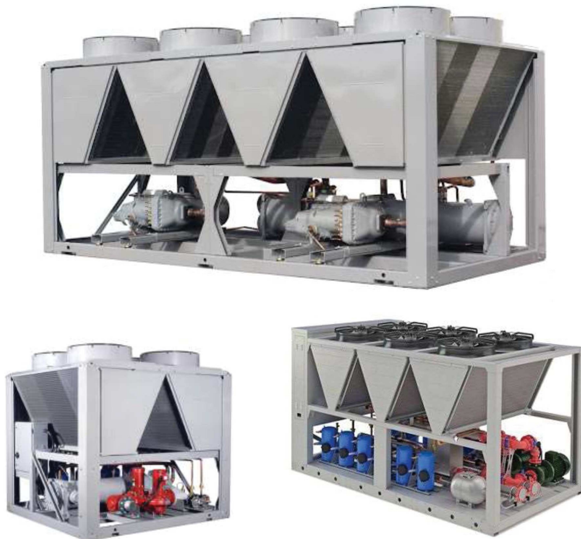
Рисунок 2 – Моноблочные чиллеры с конденсатором воздушного охлаждения