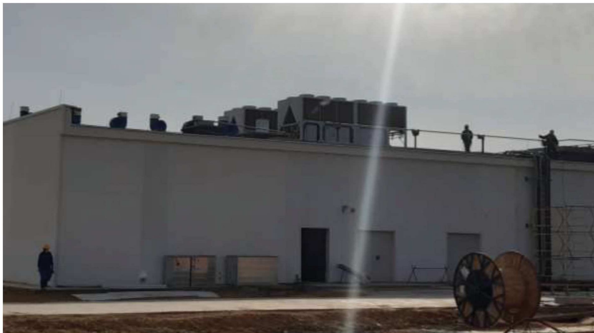
Рисунок 7 – Процесс монтажа моноблочного чиллера на кровле здания