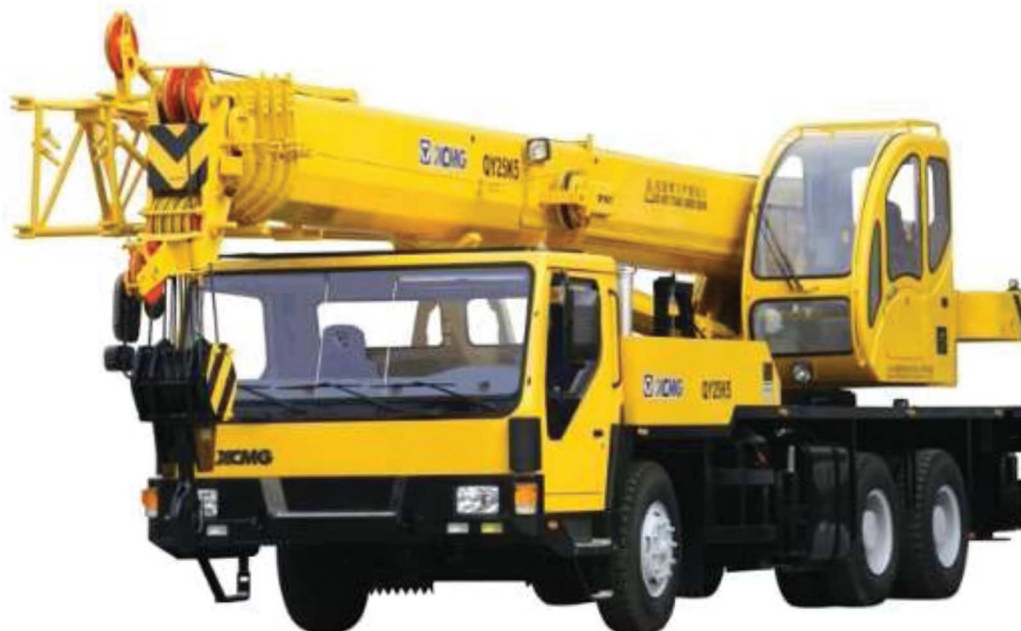
Рисунок 4 – Общий вид автокрана грузоподъемностью 25 т

Технические характеристики крана автомобильного типа «XCMG QY25K5» приведены в таблице 2.